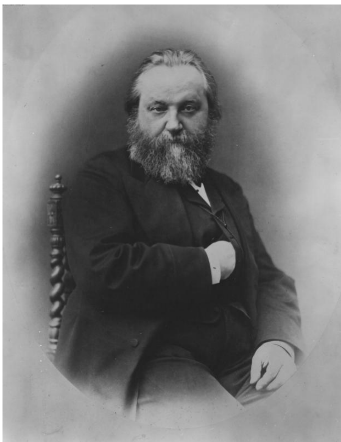
Козьма Терентьевич Солдатёнков (1818–1901)

Козьма Терентьевич Солдатёнков (1818–1901) – личность невероятно интересная, разносторонняя и во многом противоречивая.